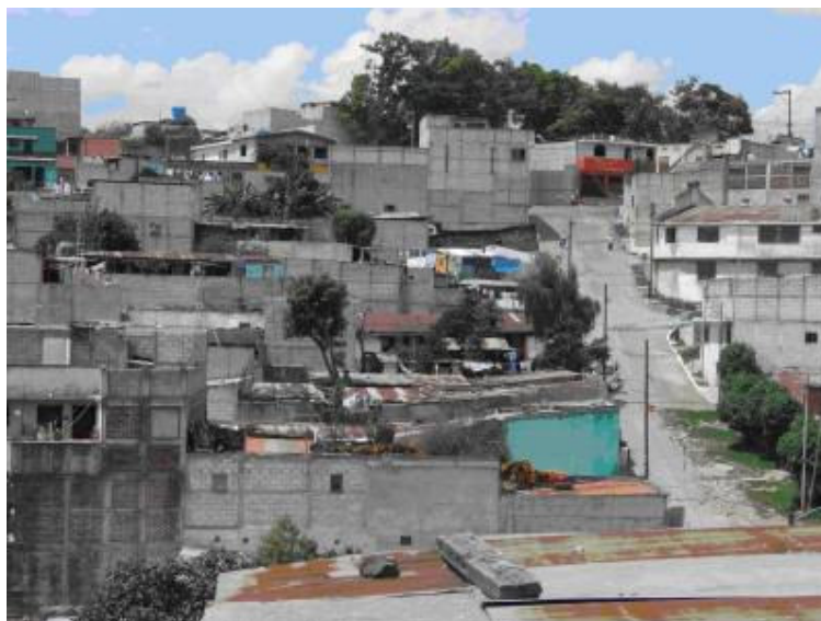
Barrio El Limón