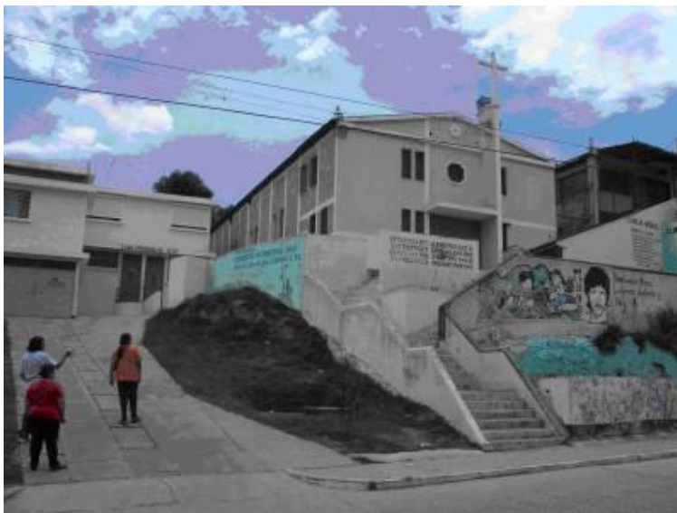
Parrocchia El Limòn